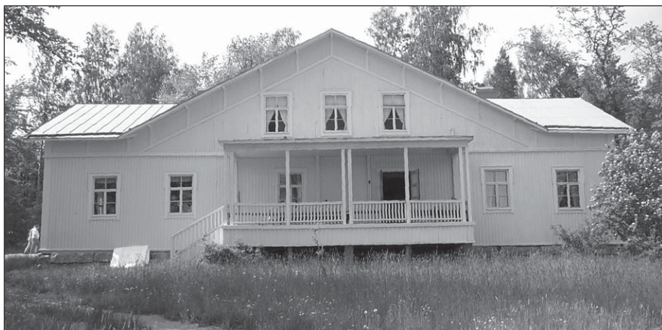
Villa Cawén on kulttuuri- ja juhlatalo, mutta myös kahvila, kauppa, kirjasto ja posti. Se on tärkeä kohtaamispaikka niin mökkiläisille kuin kylän parlamentillekin.

Syksyllä on ilon aihe kun Vespuolen (ent. Oittilan) koulu saavuttaa kunnioitetavan 100 vuoden iän. Sen toiminta jatkuu yhä ja pienet taaperot pääsevät aloittamaan koulutiensä 13.8. Hirvijahti näkyy ja kuuluu sitten myöhemmin syksyllä kylän raitilla, ja maanviljelijät aloittavat syyskiirensä.