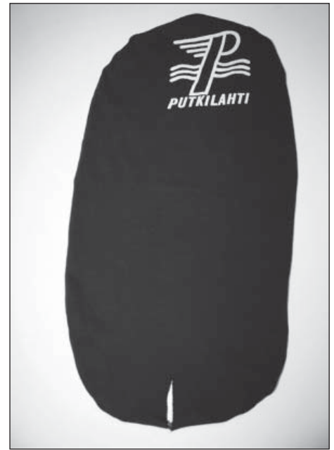
Kyläpipo tekovaiheessa: ks. kohdat 6-8