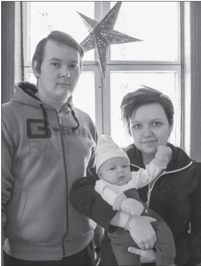
Putkilahden nuorin asukas vanhempiansa kanssa