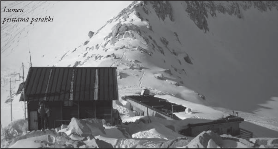
Lumen peittämä parakki

sina väliseiniä on rakennettu ahkerasti ja pienempiäkin huoneita alkaa olla tarjolla. Me viritimme makuupussimme kaikki samaan huoneeseen.