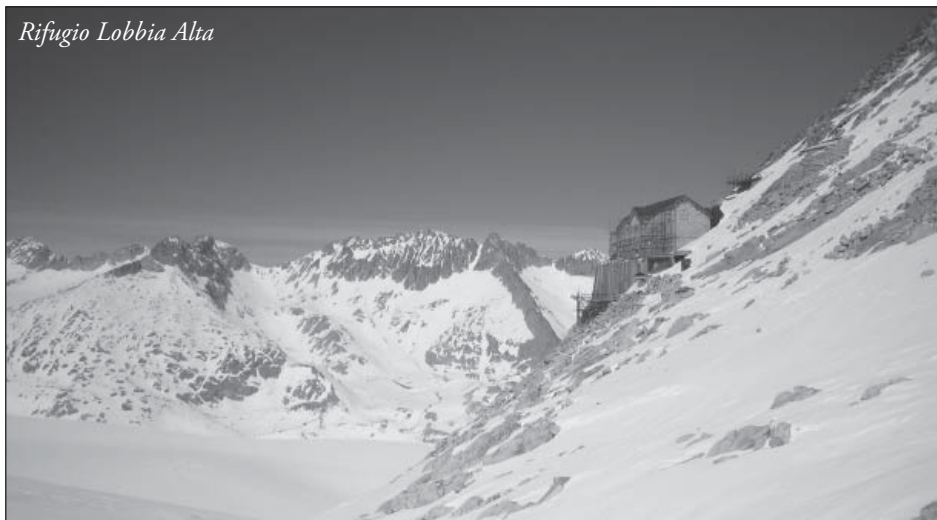
Rifugio Lobbia Alta

metrin korkeudessa Cima Presena -nimisen vuorenhuipun vieressä.