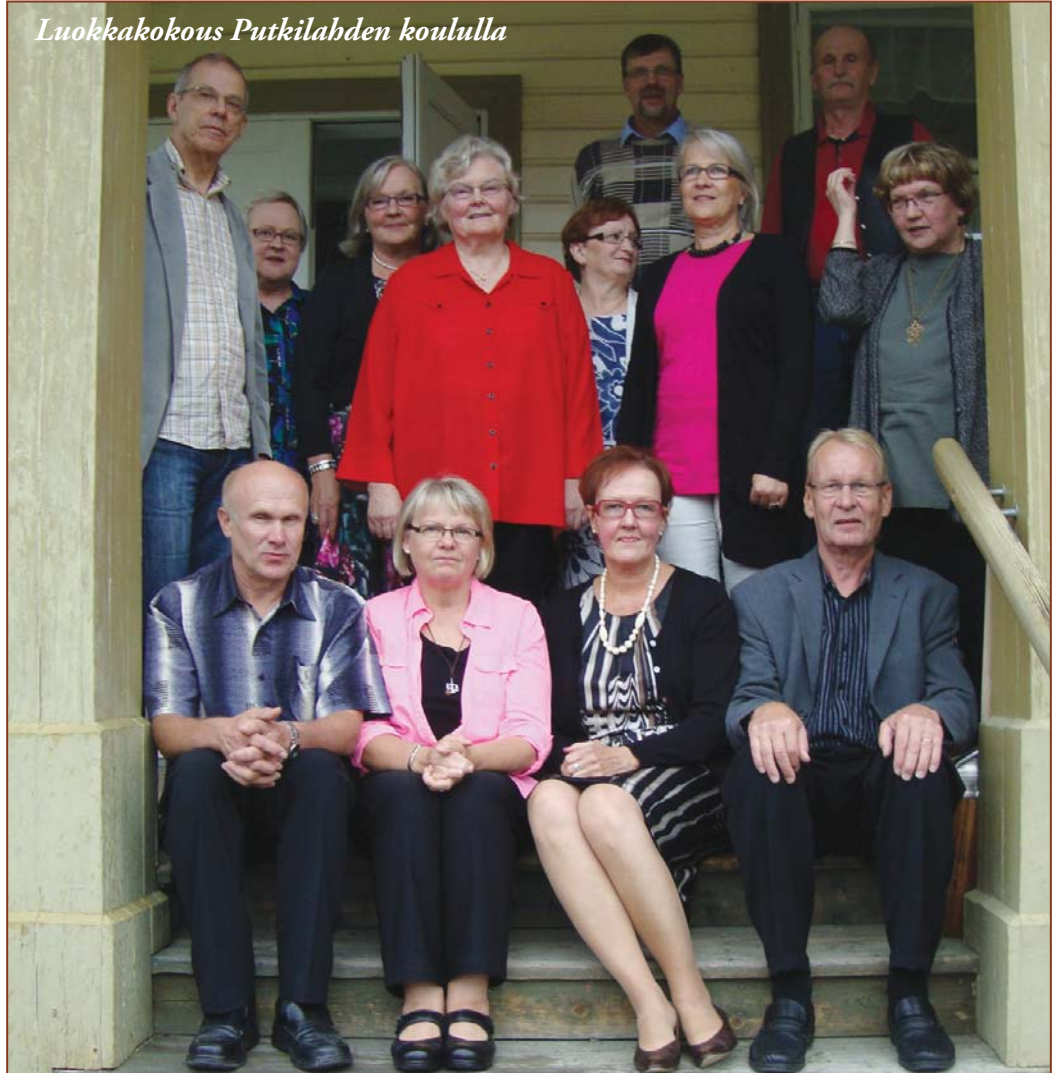
Luokkakokous Putkilahden koululla