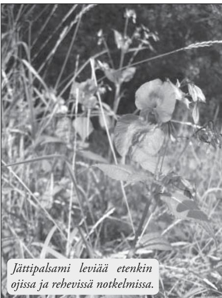
Jättipalsami leviää etenkin ojissa ja rehevissä notkelmissa.